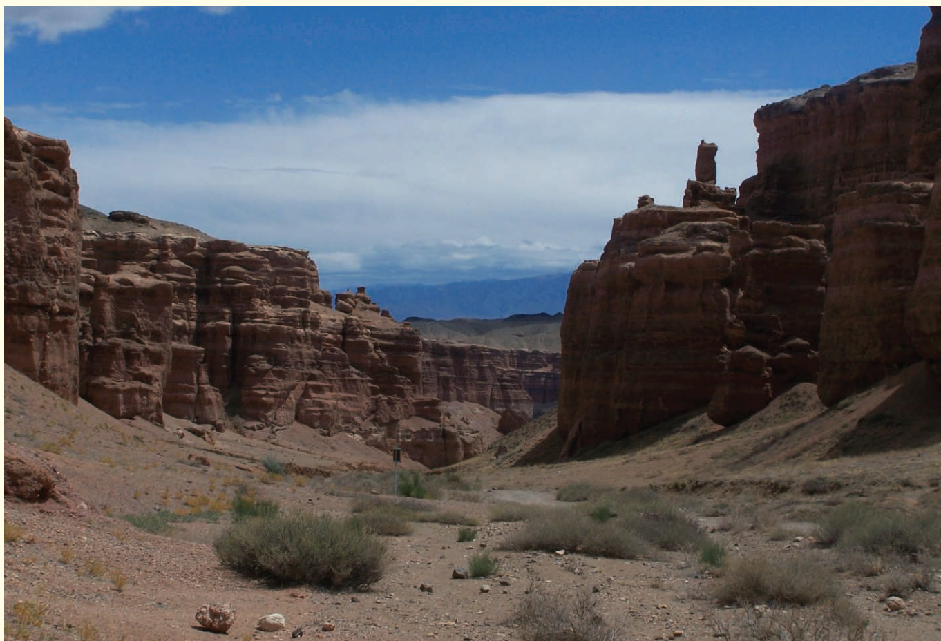
Kanion Czaryński, południowo-wschodni Kazachstan, blisko gór Tianszan