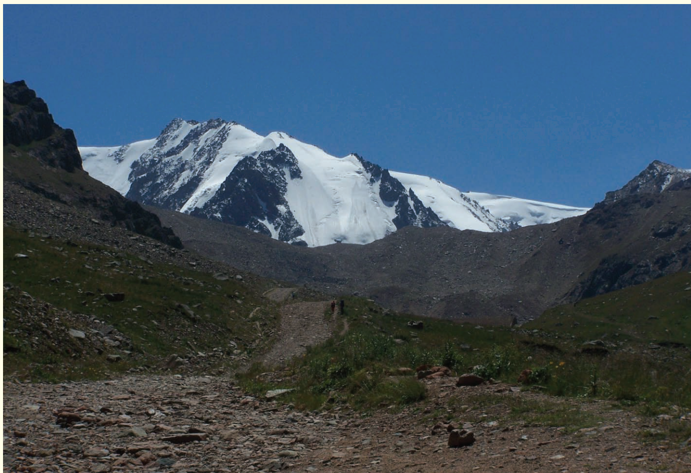
Widok na Czimbulak, 3200 m npm, południowo-wschodni Kazachstan