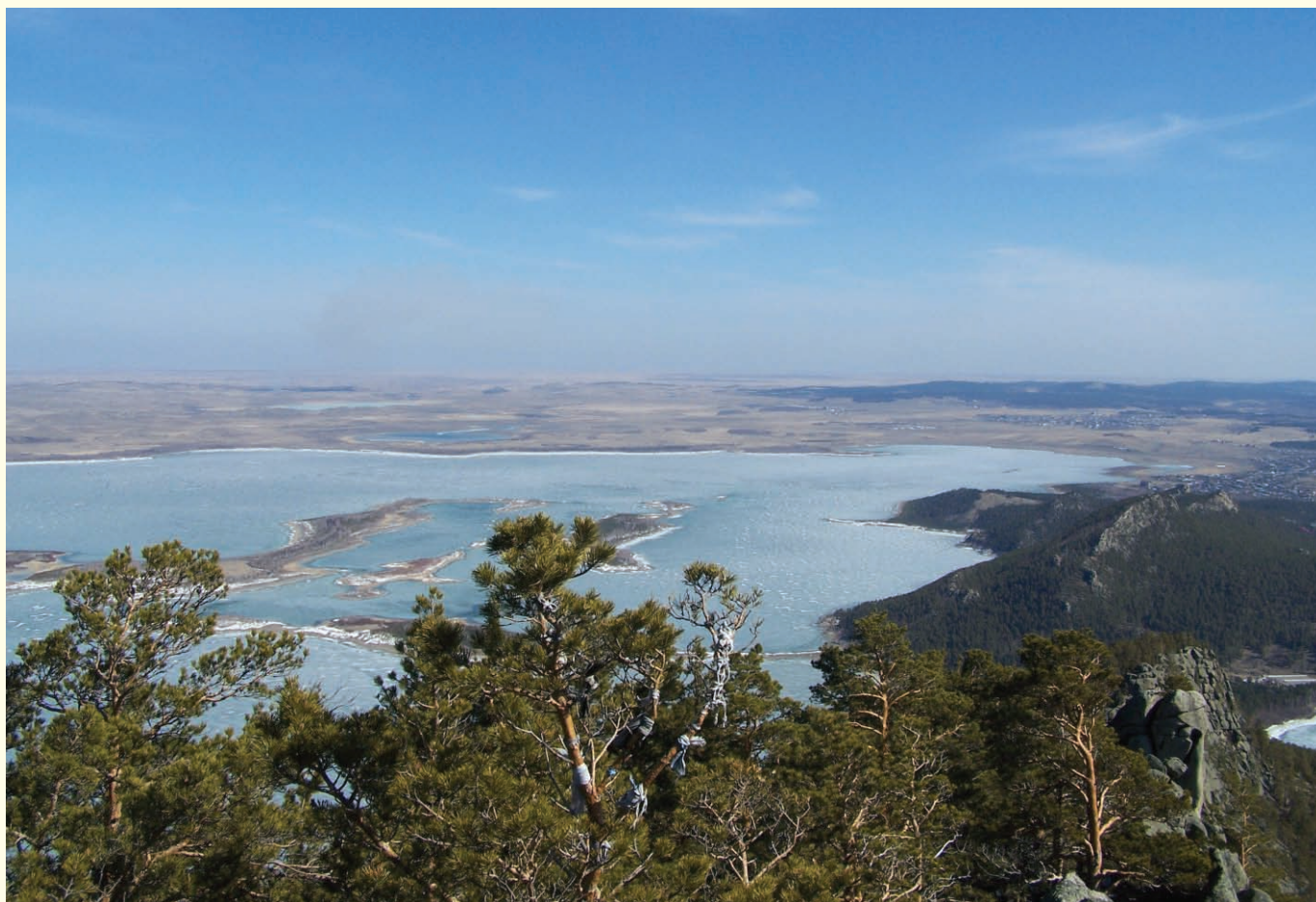
Widok z góry Siniucha na jezioro Małe Czebacie, Barowoje